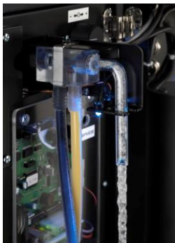
Detail MidMix II